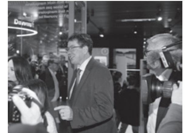
Bundesrat Albert Rösti anlässlich der Ausstellungseröffnung.

Vernissage «Wirklich?! (...)», 13. Oktober 2025. Die im Verkehrshaus in Anwesenheit von Medienminister Albert Rösti eröffnete Ausstellung zeigt, wie wichtig Medienkompetenz ist.