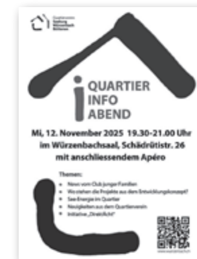
Der Flyer für den Quartier-Infoabend. keh

Weitere Themen siehe Flyer unten. Es gibt im Anschluss an die Informationen einen Apéro, eine Anmeldung ist nicht notwendig.