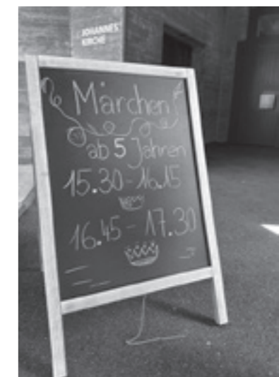
Impressionen vom Spielgruppe-Jubiläumstag: Die aktuellen (links unten) und ehemaligen Leiterinnen (oben), Highlights waren das Kinderschminken und das Märchenzelt. Djellza Nuaj