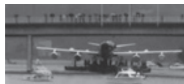
Am 2. Juni 2025 bei der Achereggbrücke. Screenshot

Die Coronado kam zwischen 1962 und 1969 bei Flügen in den Mittleren Osten sowie Westafrika und Südamerika zum Einsatz, ab 1970 nur noch auf Europastrecken. Sie hatte als schnellstes Unterschallflugzeug den Ruf des Sportwagens unter den Passagierjets. Dennoch steht sie im Verkehrshaus vor der Luftfahrts- und nicht vor der Autohalle. egg