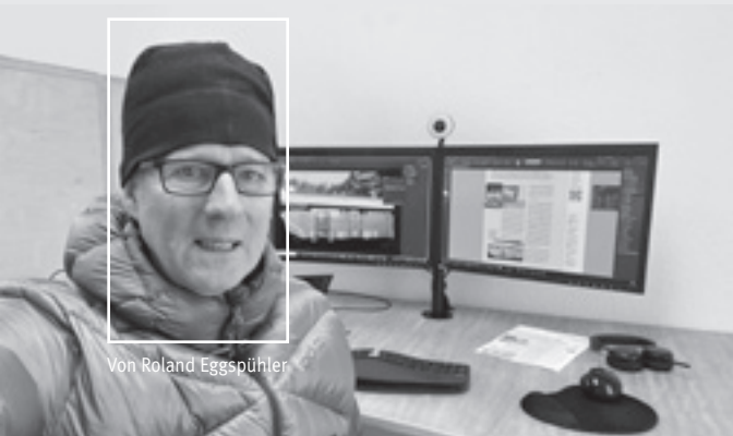
Von Roland Eggspühler

Neulich im Quartier... ...startete die Grossbaustelle oberhalb der Migros Würzenbach. Der terrassierte Wohnteil des Hauses Würzenbachstrasse 17 wird komplett saniert. Der Büro-/Praxisflügel, in welchem unter anderem auch der SeeBlick produziert wird, ist nicht Teil des Projekts. Nur weiss das kaum jemand. Ein Blick auf eine Woche Leben neben der Baustelle.