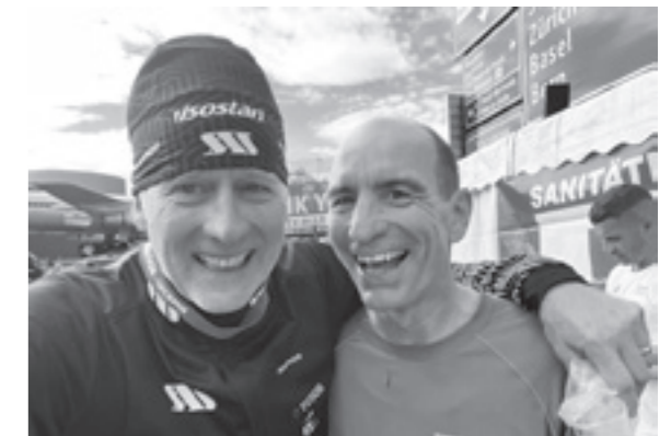
Alpnach und zurück zum Marathon-Ziel ins Verkehrshaus. egg

Ich gelange an die Stelle, wo eine Gerüsttreppe über die Laufstrecke führt. Als Läufer schätze ich es ja sehr, wenn nicht alle quer über die Strecke «hühnern». Aber als Finisher mögen es meine müden Beine überhaupt nicht, dass sie jetzt diese fünf Höhenmeter überwinden müssen. Ich überlege mir, wie man Schindler dazu bringen könnte, beim Marathon als Sponsor einzusteigen und diese Übergänge mit Rolltreppen zu bestücken. Ja, das wärs!