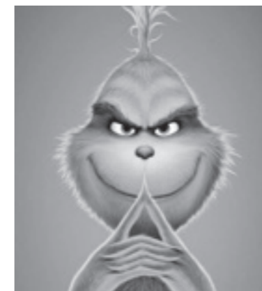
Der Grinch. pd