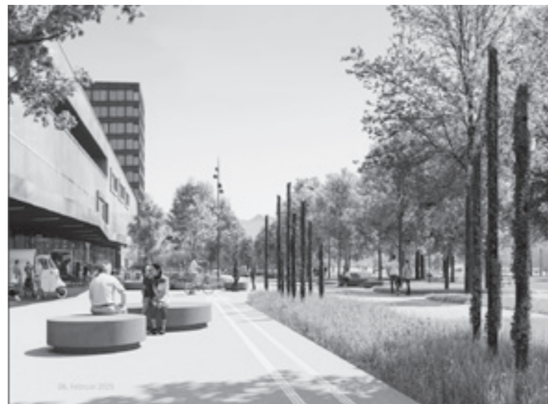
Der geplante «shared space» vor dem Verkehrshaus-Haupteingang.

Als Verkehrsregime soll weiterhin Tempo 30 im Gegenverkehr gelten, wobei im Bereich der Vorzonen von Verkehrshaus, Minigolf, Strandbad und Tennisclub so genannte «shared spaces» vorgesehen sind – diese sind optisch differenziert von der