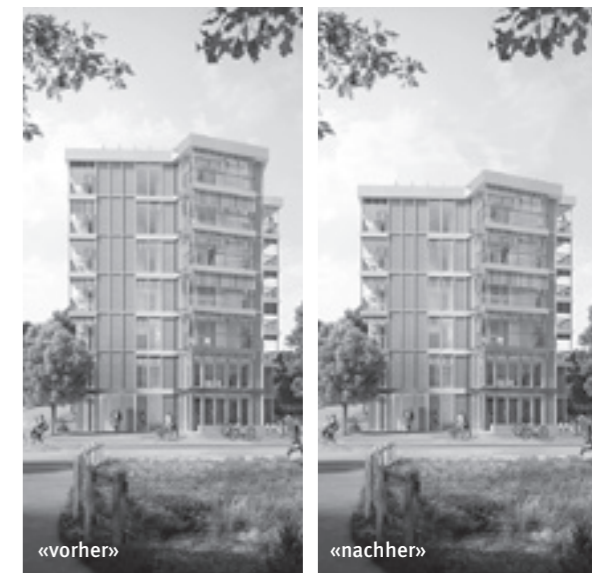
Die vereinfachte visualisierten projektspezifischen Auswirkungen der zurückgewiesenen BZO-Revision. pd

Nach dem Abschluss der Planungsphase wird das Bauprojekt dem Grosse Kirchenrat (Parlament) vorgelegt. Dieser entscheidet, ob und allenfalls welche Anpassungen am Projekt vorgenommen werden sollen – möglich ist das jeweils im Juni und Dezember, den beiden Sessions-Terminen des Grosse Kirchenrates. Sobald der Baukredit gesprochen ist, kann die Baubewilligungsgesuch eingereicht werden – und dieses Verfahren dauert in der Stadt Luzern bekannterweise einiges länger als in anderen Gemeinden. Wann die Bagger auffahren können, ist in der aktuellen Ausgangslage also sehr offen. pd/red