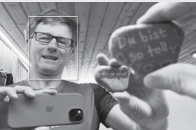
Von Roland Eggspühler

Neulich im Quartier... »stolperte« ich über einen Stein. Nicht physisch oder gar mit gefährlichem Sturzpotenzial, sondern optisch und vor allem auch sonst. Denn der Stein lag auf einem Mäuerchen, und er enthielt eine unerwartete Botschaft: Geflasht von «Du bist so toll» ging ich der Sache nach. Sie führte mich auf den Hashtag #tutmirgutwuerzenbach.