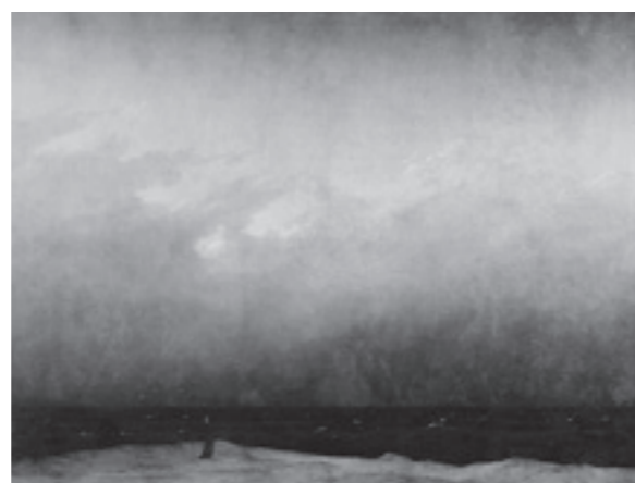
«Der Mönch am Meer» von Caspar David Friedrich.