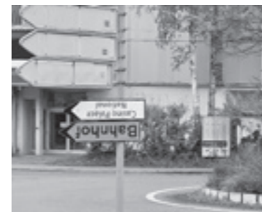
Beim Brüelkreisel am Marathonsonntag.

Rund um den Luzerner Marathonsonntag von Ende Oktober gab es wieder sehr viele Umleitungsschilder, und einige von ihnen standen auf dem Kopf. Sehr wahrscheinlich, weil an jenem Tag fast das ganze Quartier Kopf steht!