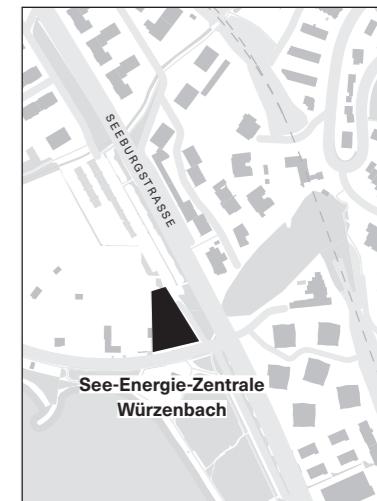
«Unsere» Zentrale kommt ins Brüelmoos.