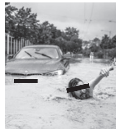
Das Bild, mit dem die Stadt Luzern ihre Projektpräsentation startete.

Gesamtprojekt C: Revitalisierung und Hochwasserschutz Würzenbach. Eine gesamtheitliche Betrachtung aller Wasserprozesse steht hier im Zentrum, wobei die Defizite (Naturgefahren und Ökologie) ebenso gesamtheitlich behoben werden sollen.