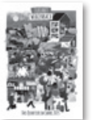
Das «Zielbild 2035» war das Schlussdokument von «Zukunft Würzenbach».

Die Defizite sind im Rahmen der Vorstudie erkannt worden: Beim Teil-