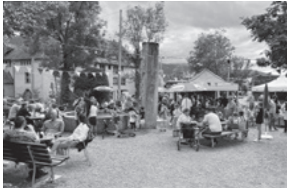
Das Buvette-Wochenende von Mitte Juni 2024.

Buvette zweifach ausgezeichnet. Die Buvette bereichert seit fünf Jahren das Quartierleben im Würzenbach. Dafür ist der Verein Buvette Würzenbach mit dem Anerkennungspreis Quartierleben der Stadt Luzern ausgezeichnet worden. Zudem erhielt er praktisch zum selben Zeitpunkt von der Katholischen Kirchgemeinde Luzern einen weiteren, namhaften Beitrag zugesprochen.